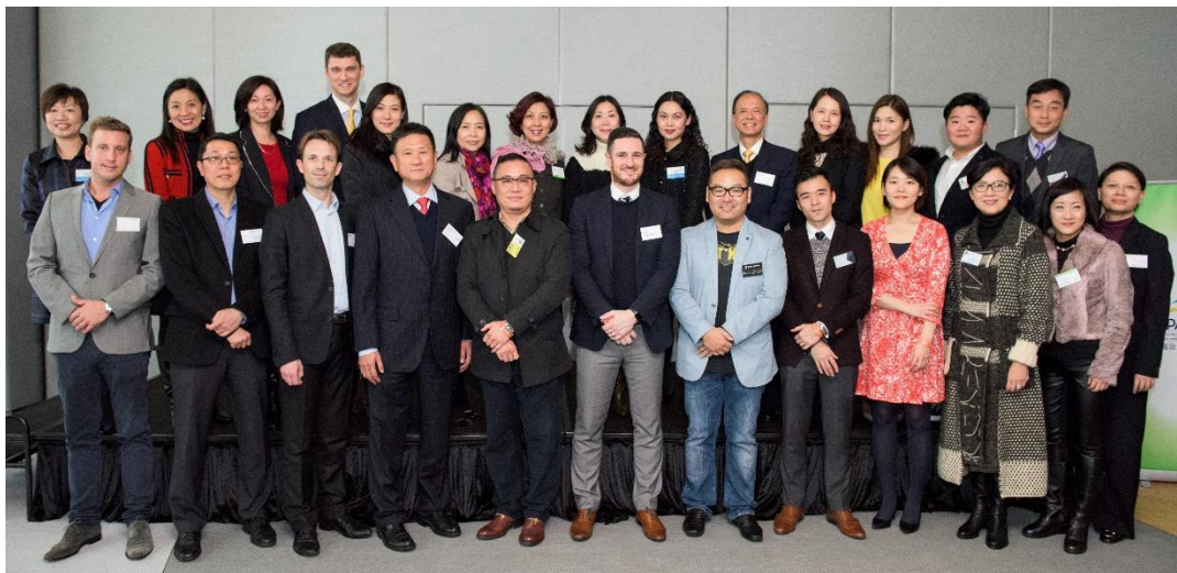
圖三：香港遊樂園及景點協會會員拍攝大合照